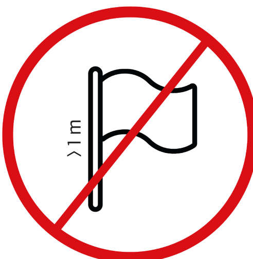
maszty flagowe lub banerowe o większej długości niż 1 m i średnicy niż 1 cm