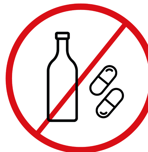
napoje alkoholowe, narkotyki, substancje pobudzające i psychotropowe