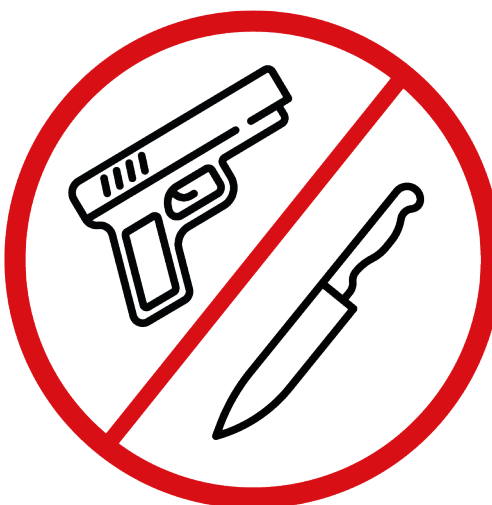
broń, materiały wybuchowe, których można użyć jako broń

11.3 Cracovia zastrzega sobie prawo do zmiany niniejszego Regulaminu w każdym momencie. O zmianie Regulaminu Cracovia poinformuje na swojej stronie internetowej: www.cracovia.pl . Zmiana Regulaminu wchodzi w życie z dniem publikacji jednolitego tekstu Regulaminu na stronie internetowej Cracovii.