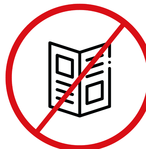
materiały promocyjne i komercyjne