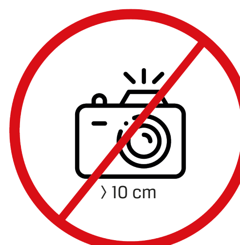
profesjonalne aparaty fotograficzne, kamery wideo z obiektywem większym niż 10 cm