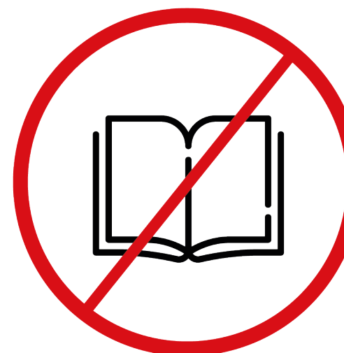
materiały rasistowskie, ksenofobiczne, polityczne, propagandowe i religijne