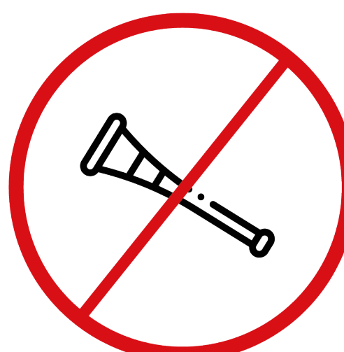
wuwuzele, trąbki, urządzenia emitujące dźwięki