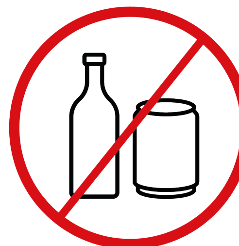
butelki, kubki, dzbanki, opakowania PET, szklane