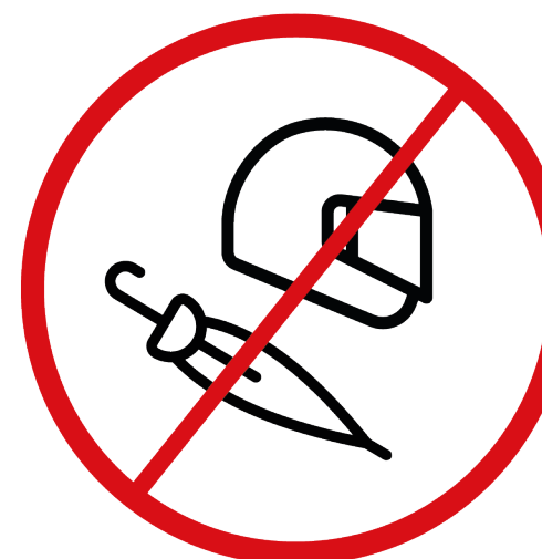
kaski, parasolki z ostrym zakończeniem