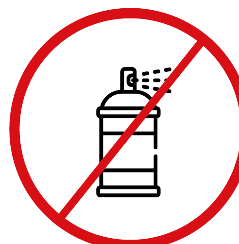
gaz w aerozolu, substancje żrące, łatwopalne, barwniki